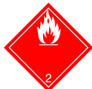
Etiqueta 2.1 : Gas inflamable.