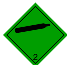
Etiqueta 2.2 : Gas no inflamable, no tóxico.